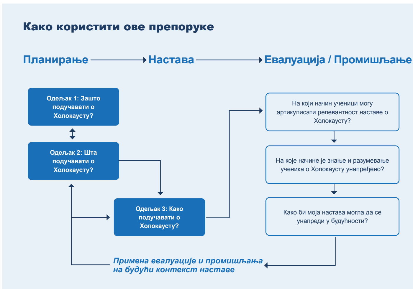
Слика 1. Како користити ове препоруке

Наставницима се саветује да прочитају Одељке 1 и 2 пре него што испланирају садржај својих часова, те да прочитају Одељак 3, како би одредили свој приступ овој настави. Одељак 3 може да послужи наставницима и као подршка у евалуацији властите наставе након одржаног часа. На овај начин, Препоруке ће бити од помоћи, како искусним едукаторима о Холокаусту, тако и онима који су нови у подучавању и учењу о Холокаусту. Следећи дијаграм представља модел овог процеса.